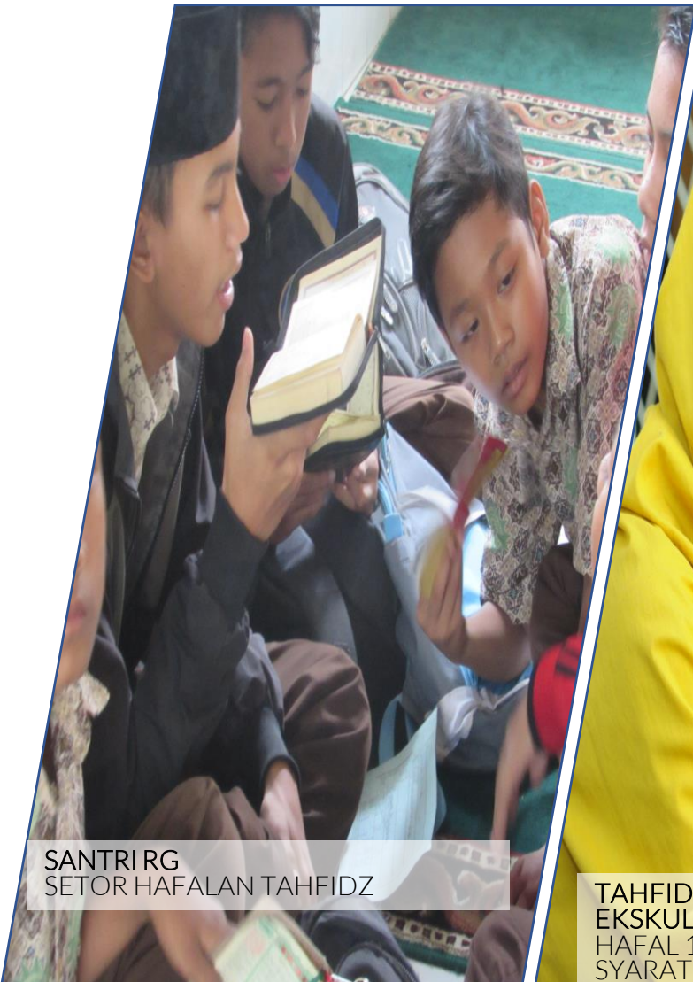
SANTRI RG SETOR HAFALAN TAHFIDZ