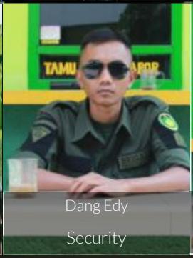
Dang Edy Security