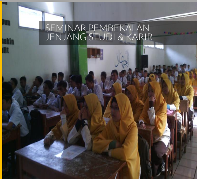
SEMINAR PEMBEKALAN JENJANG STUDI & KARIR