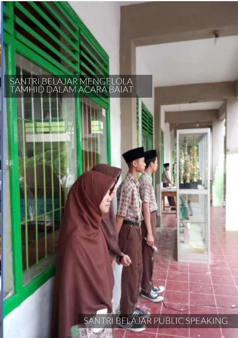
SANTRI BELAJAR MENGELOLA TAMHID DALAM ACARA BAIAT