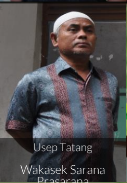
Usep Tatang Wakasek Sarana Prasarana