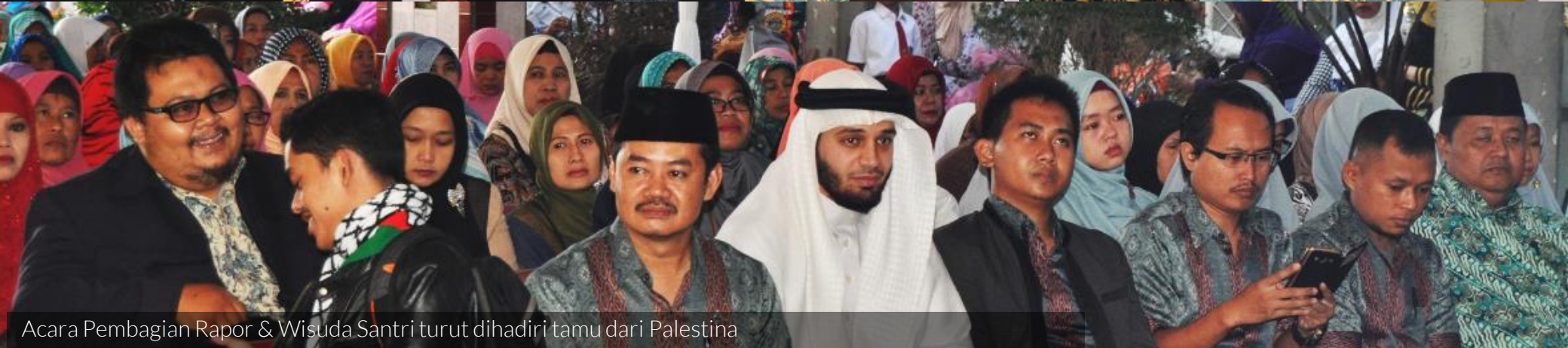
Acara Pembagian Rapor & Wisuda Santri turut dihadiri tamu dari Palestina