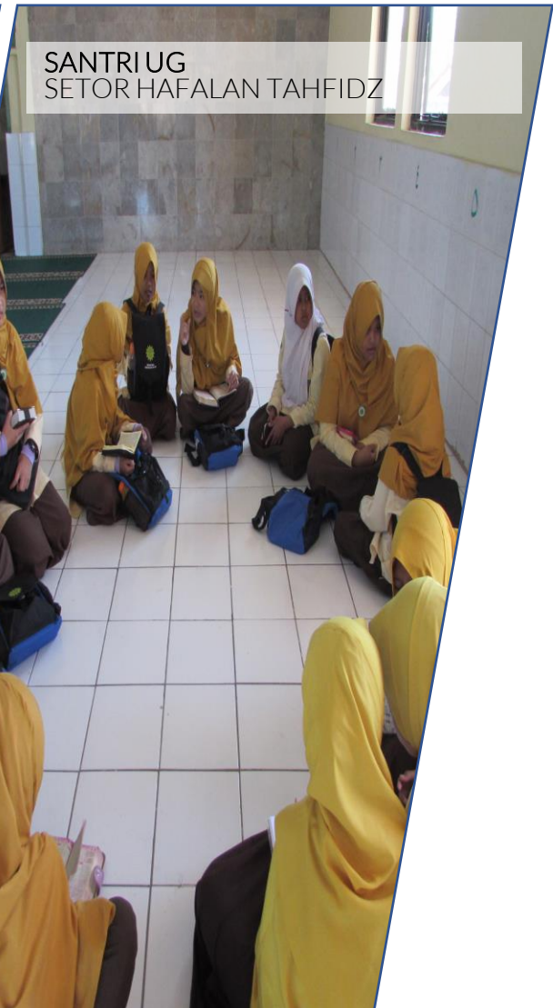
SANTRI UG SETOR HAFALAN TAHFIDZ