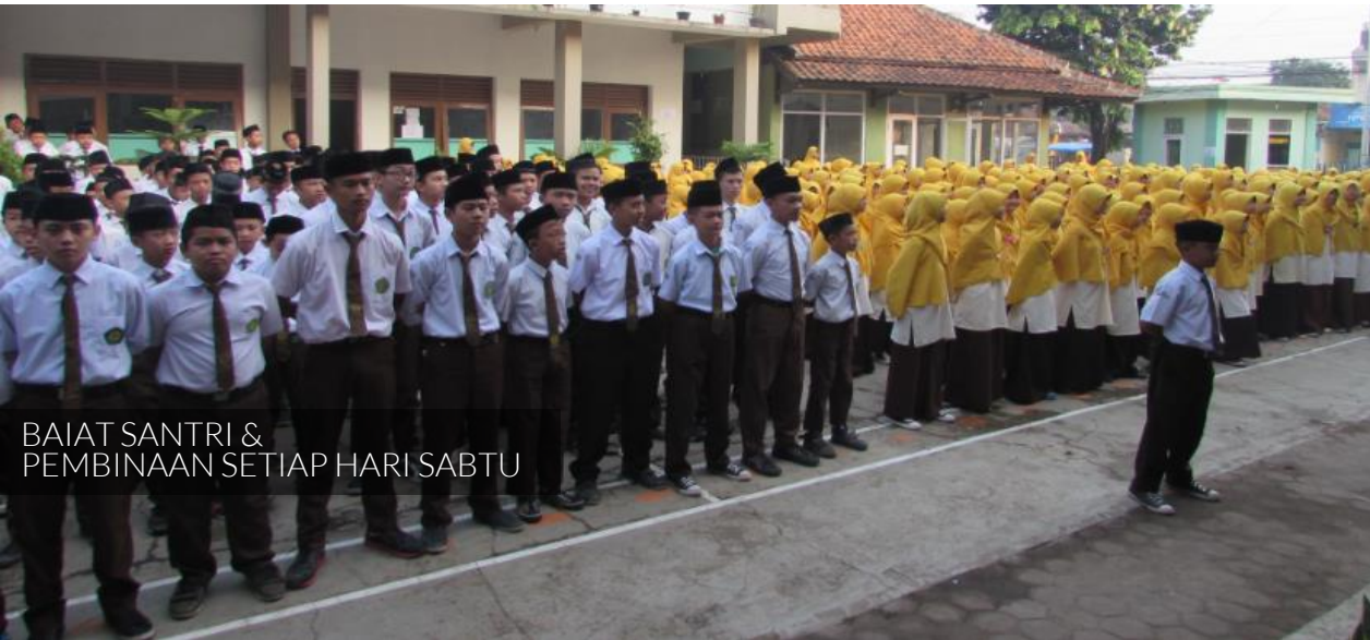
BAIAT SANTRI & PEMBINAAN SETIAP HARI SABTU