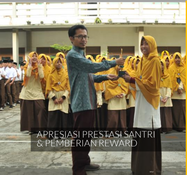
APRESIASI PRESTASI SANTRI & PEMBERIAN REWARD