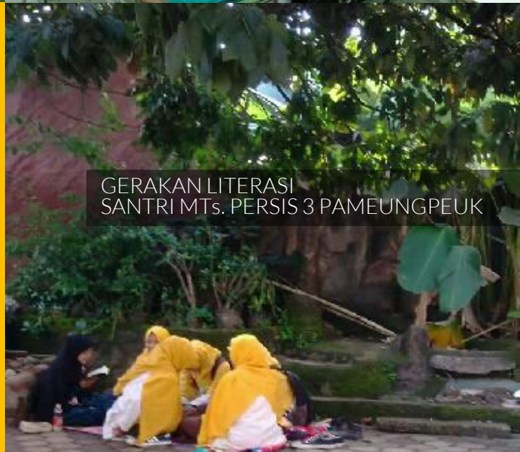
GERAKAN LITERASI SANTRI MTs. PERSIS 3 PAMEUNGPEUK

Makmurkan Kualitas Kualitas tata kelola kelas, controlling kelas, hingga kualitas nalar intelektual dengan gerakan Literasi Santri