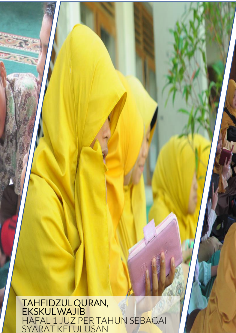
TAHFIDZUL QURAN, EKSKULWAJIB HAFAL 1 JUZ PER TAHUN SEBAGAI SYARAT KELULUSAN