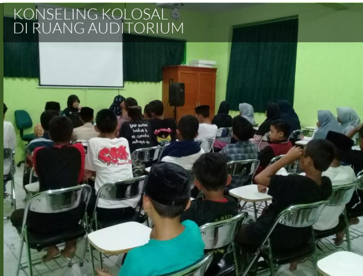
KONSELING KOLOSAL DI RUANG AUDITORIUM

Pengembangan Diri Santri difasilitasi agar bisa mengembangkan berbagai potensi akademik, non akademis dan life skill.