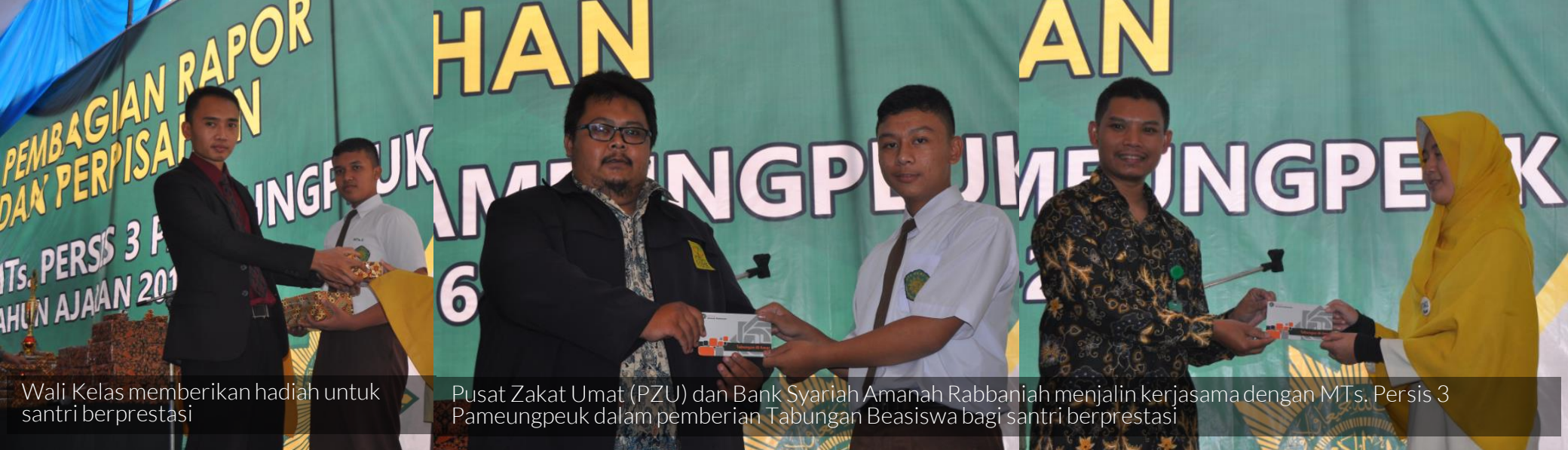
Wali Kelas memberikan hadiah untuk santri berprestasi