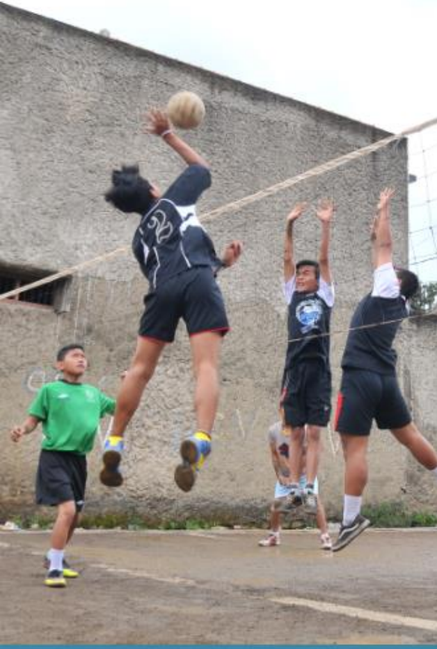
EKSKUL VOLLY BALL BERLATIH UNTUK LOMBA AKSIOMA