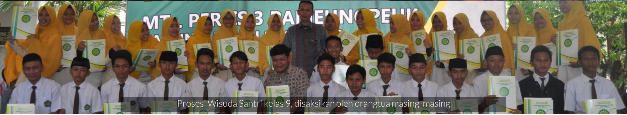
Prosesi Wisuda Santri kelas 9, disaksikan oleh orangtua masing-masing