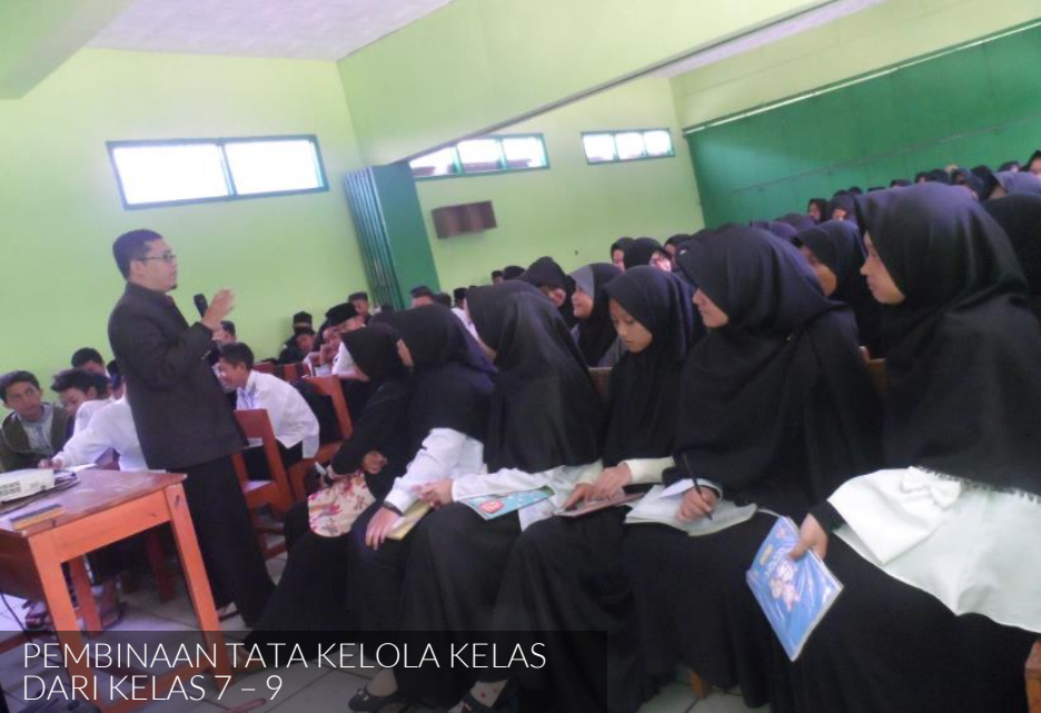
PEMBINAAN TATA KELOLA KELAS DARI KELAS 7 - 9