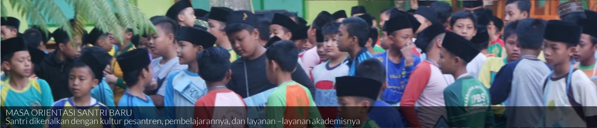
MASA ORIENTASI SANTRI BARU Santri dikenalkan dengan kultur pesantren, pembelajarannya, dan layanan –layanan akademisnya