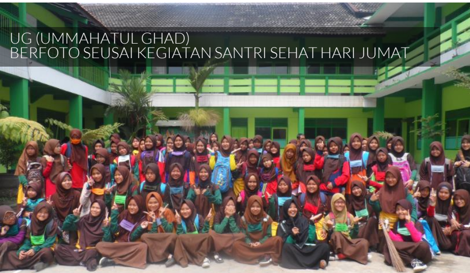
UG (UMMAHATUL GHAD) BERFOTO SEUSAI KEGIATAN SANTRI SEHAT HARI JUMAT