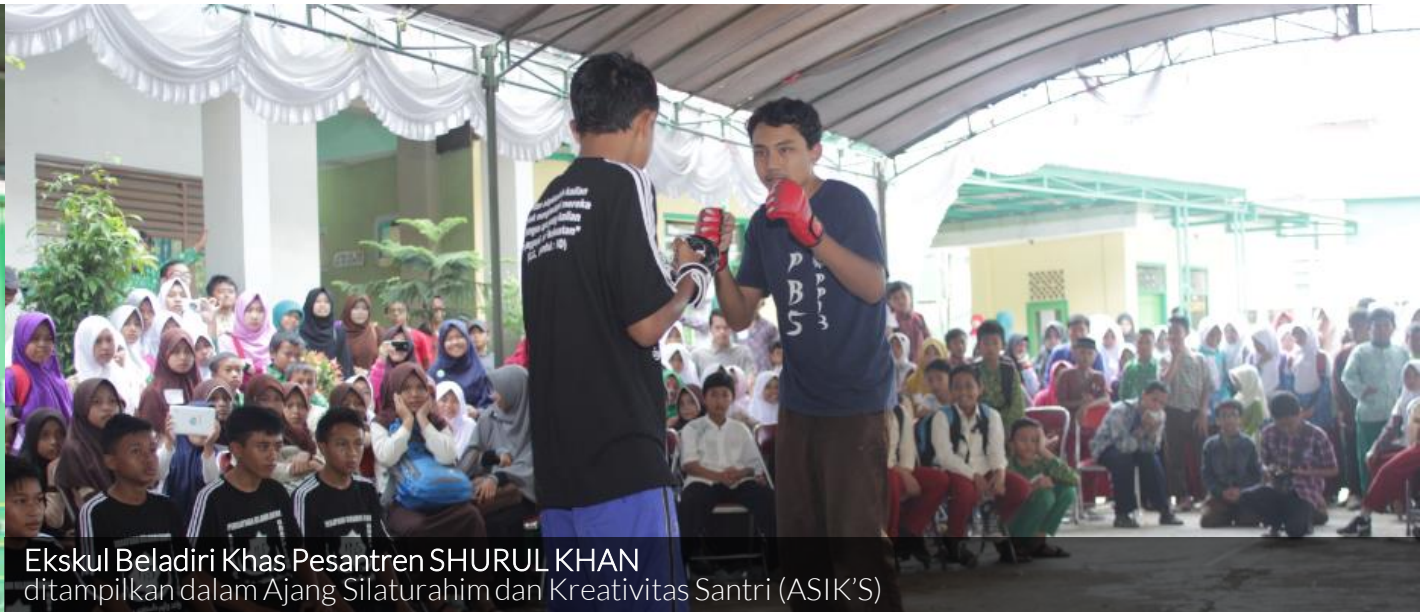
Ekskul Beladiri Khas Pesantren SHURUL KHAN ditampilkan dalam Ajang Silaturahmi dan Kreativitas Santri (ASIK'S)