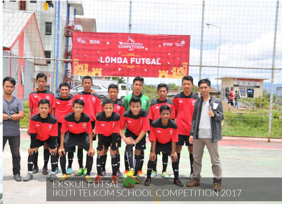
EKSKUL FUTSAL IKUTI TELKOM SCHOOL COMPETITION 2017